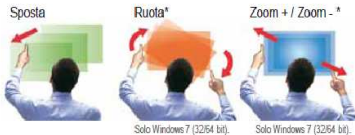
Solo Windows 7 (32/64 bit).

Le immagini possono essere spostate, ridimensionate e ruotate facilmente con le dita. Questo metodo, che prevede la libera manipolazione delle immagini, contribuisce a destare l'interesse degli studenti.